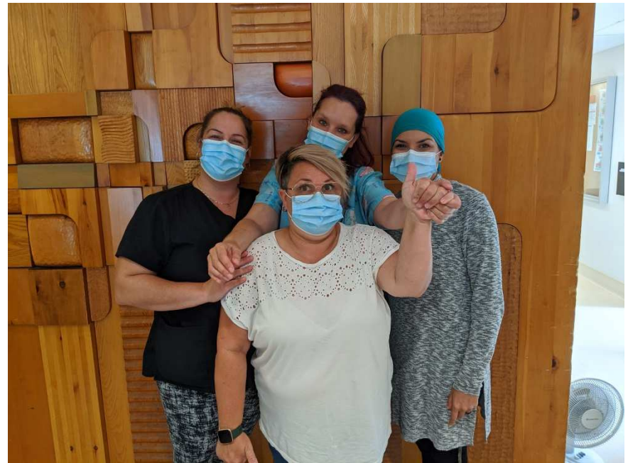
Équipe du CHSLD de St-Rémi