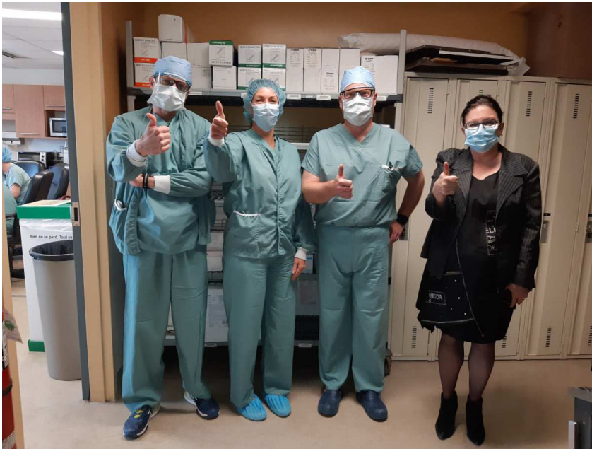
Équipe de l'Hôpital